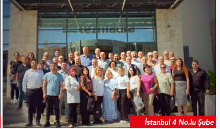
İstanbul 4 No.lu Şube