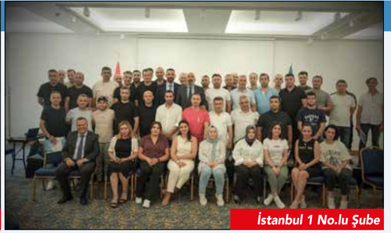
İstanbul 1 No.lu Şube