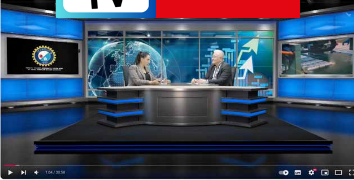
Prof.Dr. Mustafa Durmuş ile Ekonomi Politik / Vergi Adaletsizliği

Tez-Koop-İş TV yenilenen yüzüyle yayım hayatına yeniden başladı. YouTube ve sendikamız internet sitesi üzerinden yayım yapan Tez-Koop-İş TV, geçtiğimiz dönemden farklı olarak kendi stüdyosunda yaptığı programları da üyelerimizle buluşturuyor. Sendikamız Ek Binası'nda bulunan Eğitim Bürosu bünyesinde kurulan stüdyoda çeşitli konularda programlar yapılarak üyelerimizle buluşturuluyor. Sendikamızın yaptığı eğitim çalışmaları, bilgilendirme toplantıları, eylemlerle ilgili haber videolarını da kanalımızda bulmanız mümkün.