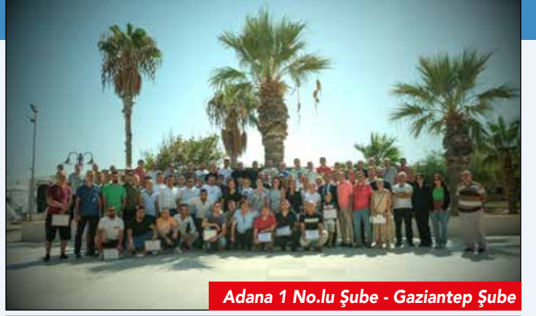
Adana 1 No.lu Şube - Gaziantep Şube

Eğitim programlarımız illerde yapılacak işyeri eğitimleri ve Youtube kanalımızdan yapılacak programlarla devam edecek.