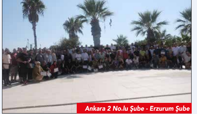
Ankara 2 No.lu Şube - Erzurum Şube