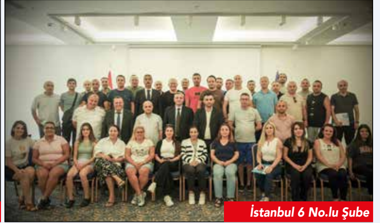
İstanbul 6 No.lu Şube