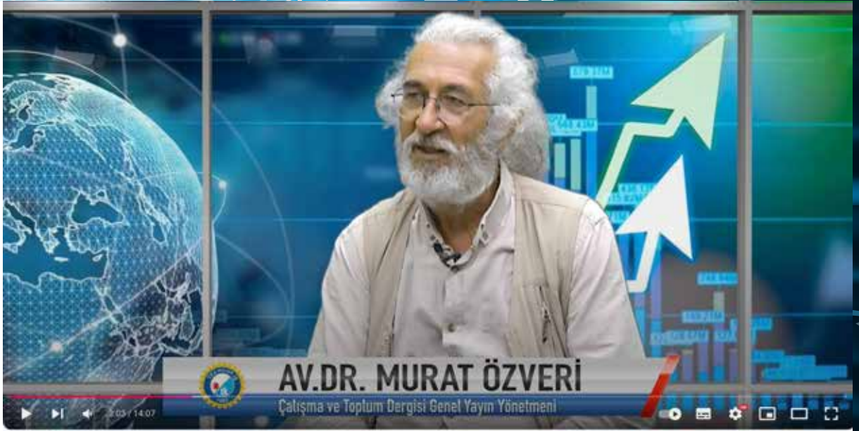
Av.Dr. Murat Özveri İle Soru Cevap - İşçi Hukuku Soruları Bölüm 1

pektiften değerlendiriyor. Popüler ekonomi programlarının ve analizlerinin aksine ekonomi alanında uygulanan politikaların işçiler açısından yorumlandığı programı sendikamız basın uzmanlarından Tuğçe Şenel sunuyor.