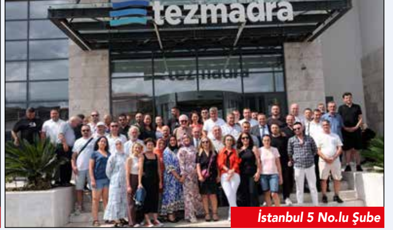
İstanbul 5 No.lu Şube