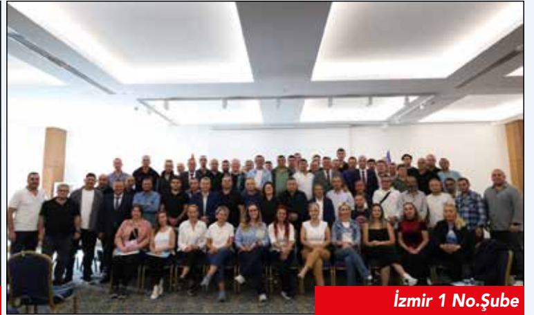
İzmir 1 No.lu Şube