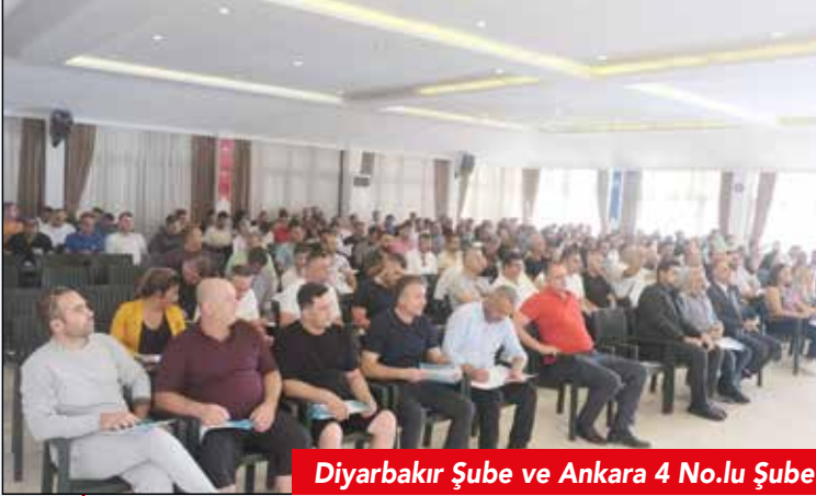
Diyarbakır Şube ve Ankara 4 No.lu Şube