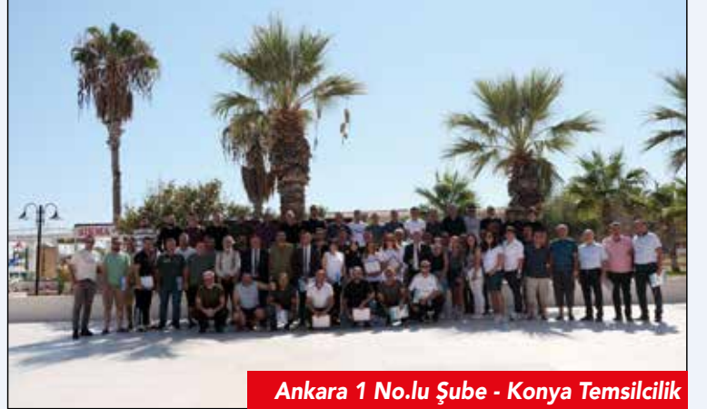
Ankara 1 No.lu Şube - Konya Temsilcilik