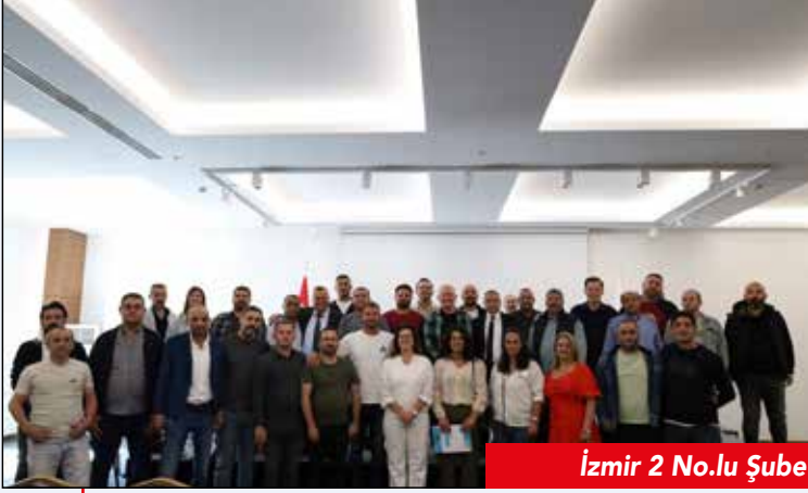
İzmir 2 No.lu Şube