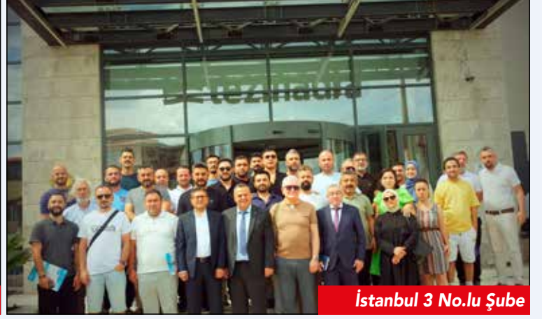
İstanbul 3 No.lu Şube