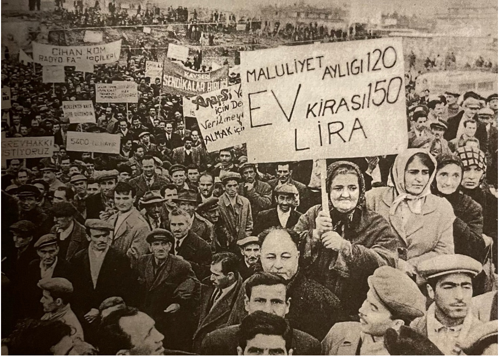
31 Aralık 1961, Saraçhane Mitingi.

Sınıf mücadelesi işyerlerinde sürerken, ancak yıllar sonra 1976 yılında 1 Mayıs, İstanbul'da Taksim Meydanı'nda kutlandı. Devrimci İşçi Sendikaları Konfederasyonu'nun düzenlediği 1976 1 Mayıs'ı, kitlesel 1 Mayıs kutlamalarının yeni bir başlangıcı oldu. Kitlesel anma ve kutlamalar, işçi sınıfının yüzbinlerce işçinin yan yana gelişile ortaya koyduğu gücün ve bu güçle doğal taleplerini kamuoyuna duyurduğu çok önemli bir zemindir. 1 Mayıs, bölünmüş ve ayrı ayrı işyerleri ve kurumlarda parça parça hale getirilmiş işçi sınıfının, kent meydanlarında aynı zamanda buluşmasının ve sözünü söylemesinin gerçekleşmesidir.